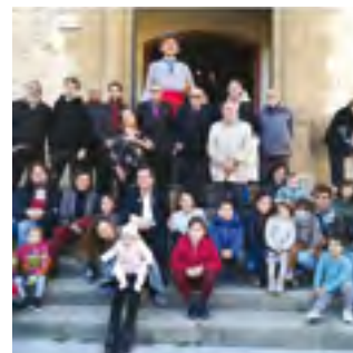
11/11/2019: Martins i Martines, el dia del sant patró