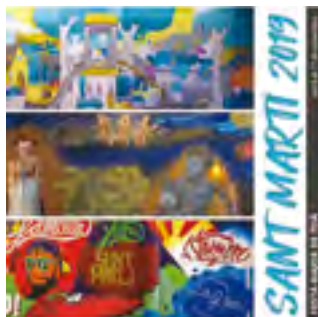
6/11/2019: Comença la Festa Major de #SantMartí2019

A continuació fem un repàs dels principals esdeveniments festius i culturals celebrats a Teià de la mà del nou canal d'Instagram de l'Ajuntament: