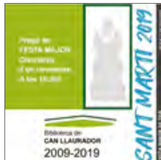
8/11/2019: La Biblioteca acull el pregó pel seu desè aniversari