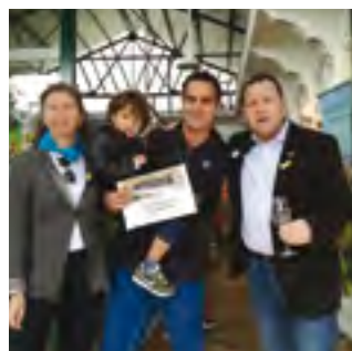
17/11/2019: La pizza de bolets i botifarra guanya el Cercatapes