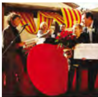
13/11/2019: Concurs de relleño, el plat típic de poma i carn