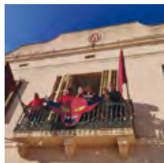
16/11/2019: Llum, foc, sofre i que cremi Teià!