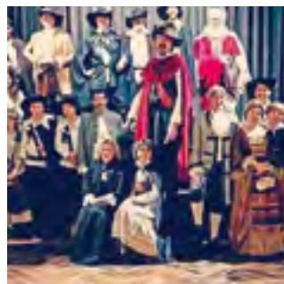
23/12/2019: Cyrano de Bergerac omple La Palma