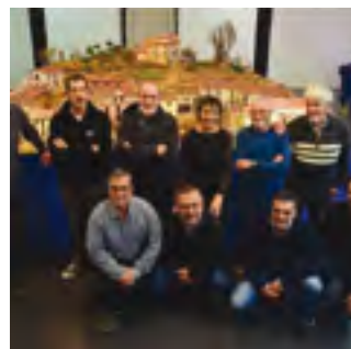
17/12/2019: 4.000 persones visiten el pessebre artístic