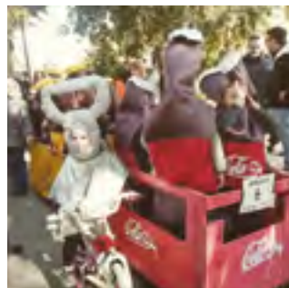
9/11/2019: 268 nens i nenes participen a la baixada de vehicles