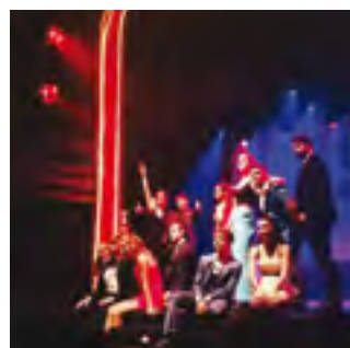
24/01/2020: Els joves, protagonistes de Royal Academy School