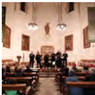
16/12/2019: El Cant de la Sibila resona a la catedral de la costa