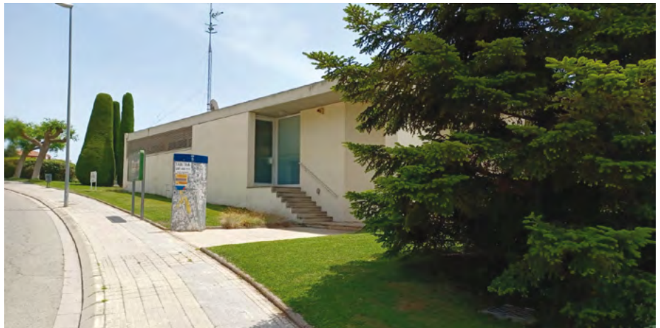
L'Ajuntament vol adequar la caseta de Sant Berger com a futura comissaria de la Policia Local.