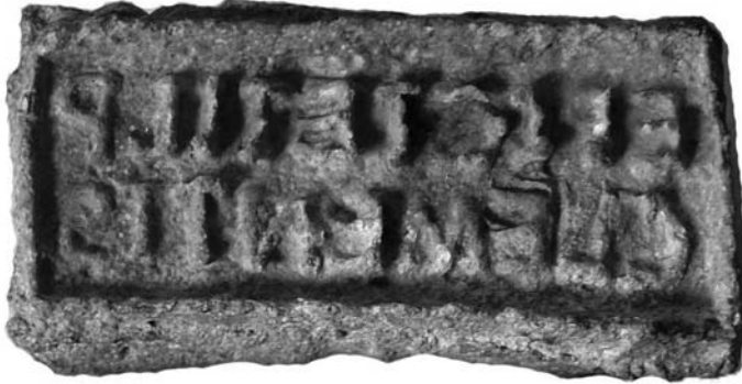
Figura 6 Signaculum de plom amb inscripció trobat al jaciment de Veral de Vallmora (Teià-El Maresme).

Mides: 3,5 x 6,6 x 1,2 cm Camp epigràfic: 2,4 x 6,2 cm