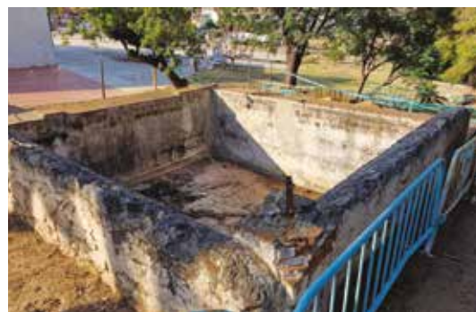
A l'esquerra, la façana de can Llaurador. A dalt a la dreta, el pou que ha recuperat l'Ajuntament per omplir l'antiga bassa de la masia.