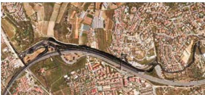
ALTERNATIVA 1. Enllaç Alella / El Masnou

En conjunt, la inversió prevista per millorar els accessos a la C-32 s'endurà 120 dels 400 milions d'euros que l'any 2023 van arribar finalment de Madrid per finançar les actuacions associades a la firma del trapàs de l'N-II a la Generalitat, l'any 2008. ■