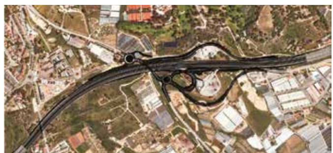
ALTERNATIVA 2. Enllaç Teià