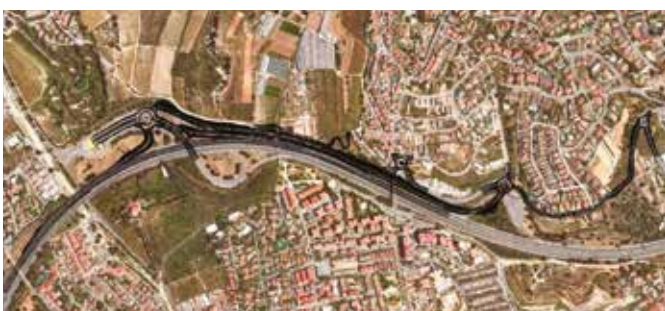
ALTERNATIVA 2. Enllaç Alella / El Masnou