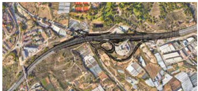
ALTERNATIVA 1. Enllaç Teià