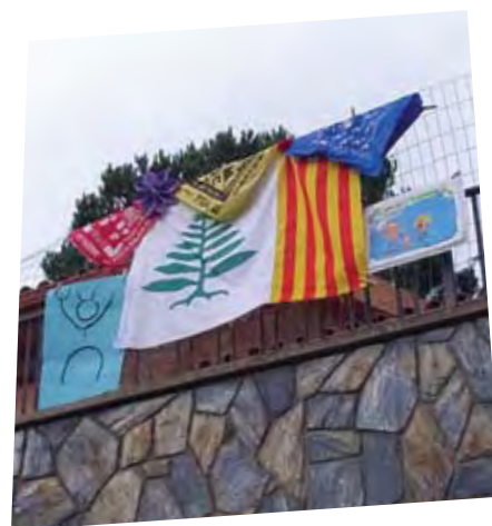
Balcó de Mariona Adarve.