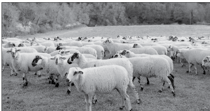
Ramats d'ovelles pasturant.

Dins el parc hi haurà diferents espais preparats per a què els ramats puguin fer nit. Un d'aquests espais serà a la nostra població.