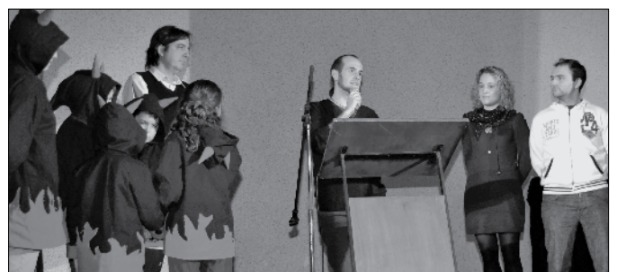
Acte de lliurament del Tei de plata.