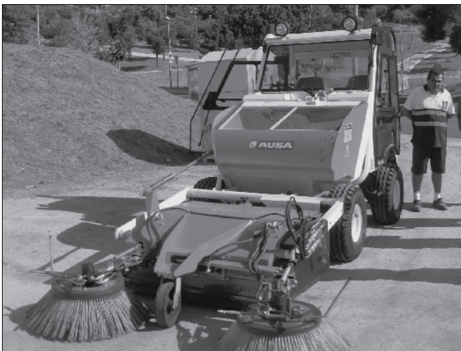
Nova màquina per a la neteja viària.

L'objectiu d'aquesta nova adquisició és millorar la neteja viària dels nostres carrers.