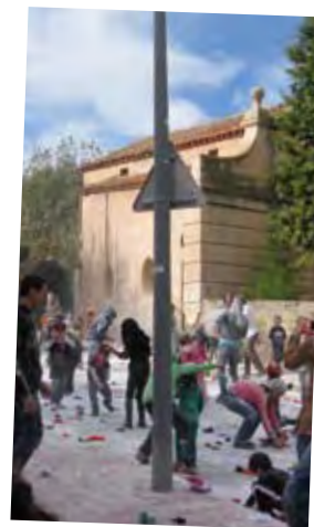
Guerra de bombardes.