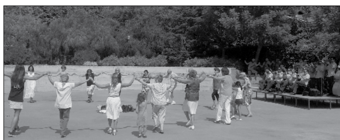
Sardanes al Parc de Can Godó.

Les eleccions es van celebrar el diumenge 25 de novembre, després d'una campanya no mancada de polèmica. Amb una participació mitjana al país d'un 69,56% (a Teià un 77,41%, 3676 persones van anar a votar), els resultats van ser més que sorprenents, sobretot si ens basem en les enquestes prèvies a les eleccions. Us deixem els resultats a la nostra Vila, realment molt allunyats dels finals a Catalunya.