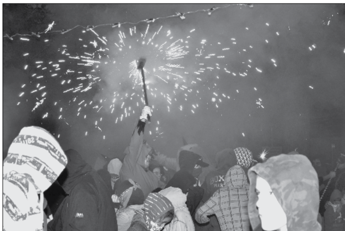
Durant el correfoc 2012.