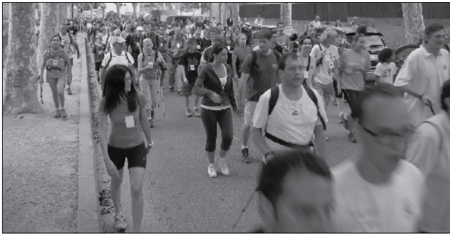
Sortida des del parc de can Godó.

El passat 23 de setembre va tenir lloc l'11a Caminada Popular per la Serralada Litoral que aquest any portava per títol "Les fonts de Teià". Un recorregut per 9 fonts de les quals 7 són dins el terme de Teià i totes recuperades o fetes noves per l'ADF de Teià.