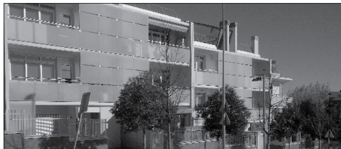
Pisos de La Plana.

Finalitzat aquest període, i després de valorar les reclamacions de la documentació que pugui mancar en alguna de les sol·licituds presentades, es farà pública la llista definitiva d'admesos i exclosos. Per últim, es realitzarà el sorteig públic per determinar quines són les persones adjudicatàries, quin habitatge els ha estat assignat i l'ordre de la llista d'espera.