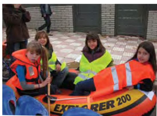
Baixada de vehicles sense motor.