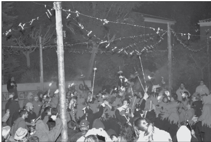
Final de correfoc.