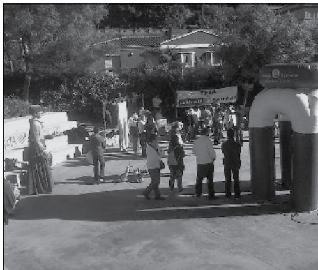
Jocs infantils dels Llubakus.