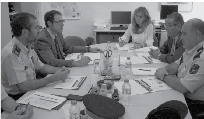
Reunió de la Junta local de seguretat.

Tanmateix es va posar de manifest entre tots els assistents a la reunió, la importància de no relaxar-se, encara que les darreres dades siguin satisfactòries, així com la necessitat de la col·laboració ciutadana en la prevenció de fets delictius, i la utilitat dels consells de seguretat per al domicili editat per l'Ajuntament.