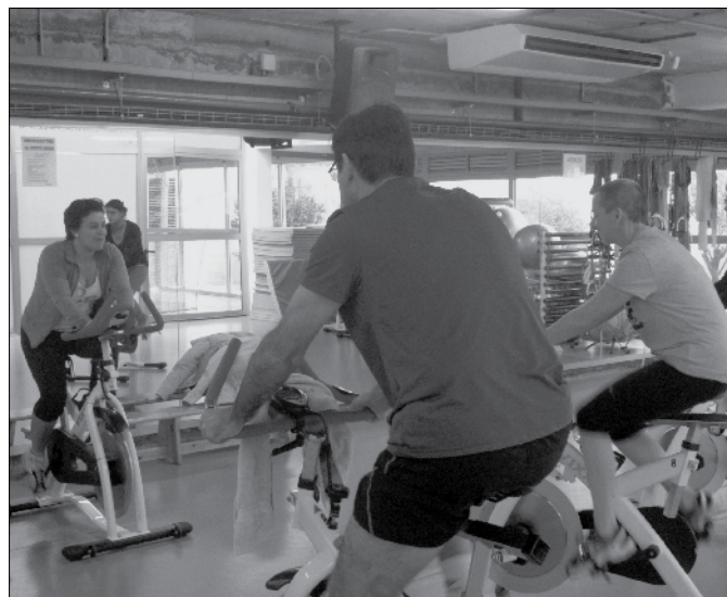
Classes d'spinning al Pavelló.

A partir del mes de gener, els aturats que vulguin fer esport gaudiran d'un descompte especial del 25% sobre el preu de l'abonament absolut. Sabedors de les greus dificultats que algunes persones estan passant actualment, amb aquesta mesura, pretenem facilitar-los l'accés al món de l'esport. També augmentem els descomptes als joves passant del 25% al 30%, i el de la gent gran, que passa del 40% al 50%. Uns bons preus, els del proper any 2013, per seguir potenciant l'esport a la nostra vila, i mirar d'evitar el sedentarisme, cada cop més present en la societat. Us esperem a tots al Pavelló. Si véns per primera vegada, accés de prova gratuïta (excepte l'spinning).