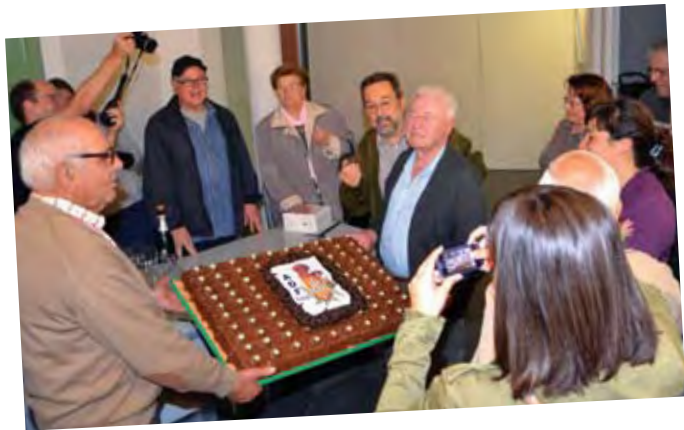
Exposició de l'ADF.