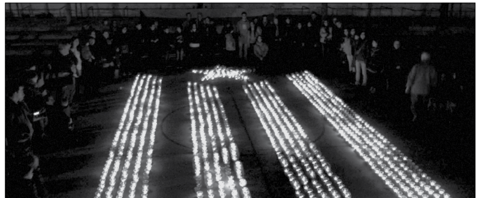
Encesa d'espelmes solidàries de l'ANC.