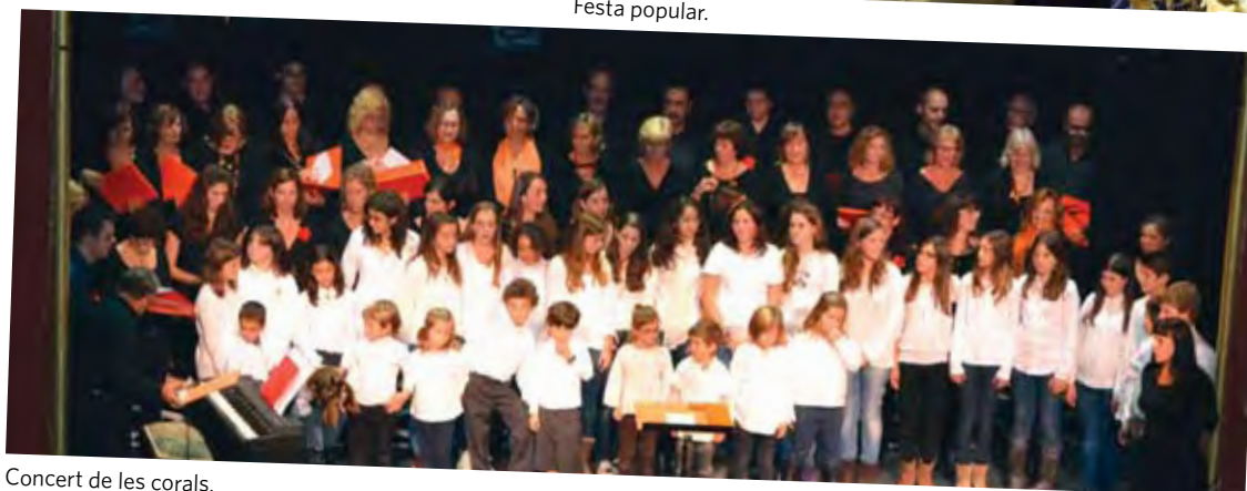
Concert de les corals.