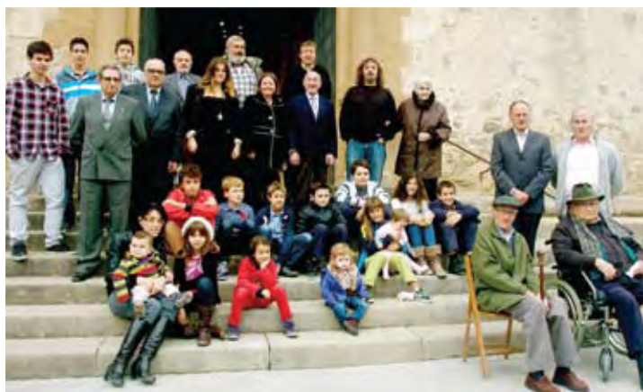
Martins i Martines de Teià.