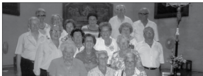
Els avis que van fer 80 anys a l'església parroquial.