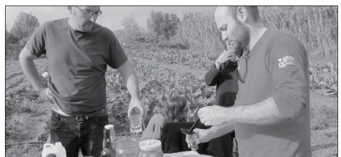
Taller de licors durant la visita a l'hort d'un productor ecològic de Teià.