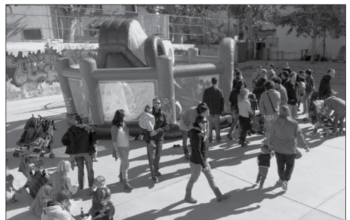
Inflables i jocs infantils.

El bon temps es va afegir a la festa, permetent als vilatans i vilatanes gaudir del poble i de la Fira, tot esperant la de l'any vinent. Aquest any tres restaurants de Teià participen a la Cuina del bolet.