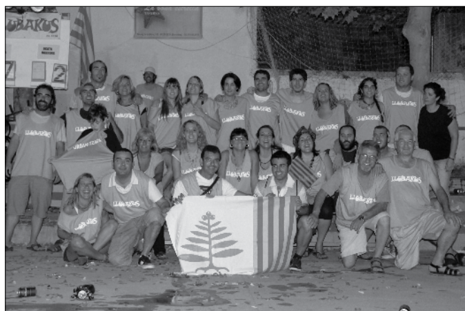
L'organització del Torneig 2012.

Segon semestre de l'any amb un bon nombre d'activitats i col·laboracions dels Llubakus a la nostra Vila. Al juliol vàrem tornar a organitzar, i ja en van quatre, el Torneig d'Estiu de Futbol Sala. Un total de 21 equips en nois i 5 en noies van fer-nos vibrar durant tot el mes, amb un futbol espectacular i un bon "flairplay". La Palma, en nois, i Starkys Team, en noies, varen ser els vencedors de l'edició d'enguany d'A Teià, el futbol engança!