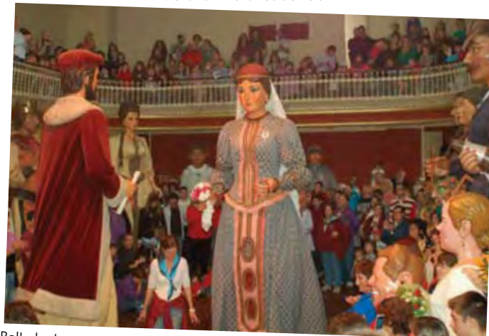
Ballada de gegants.