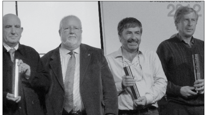
El president de la Diputació amb els guanyadors.

En aquesta XVI edició es van presentar 18 candidatures. Al Premi Palestra hi optaven les ADF: El Pinyó, Olesa de Montserrat, Esparreguera, Sabadell, Montseny Congost, Puig Vicenç, Alt Maresme, Copons i Teià. I al Premi Rossend Montané hi concorrien les ADF: Burriac, Sant Sadurní d'Anoia, Collbató, Font -Rubí, Tordera, Matadepera, Sant Salvador de Guardiola, Teià i Montseny Congost.