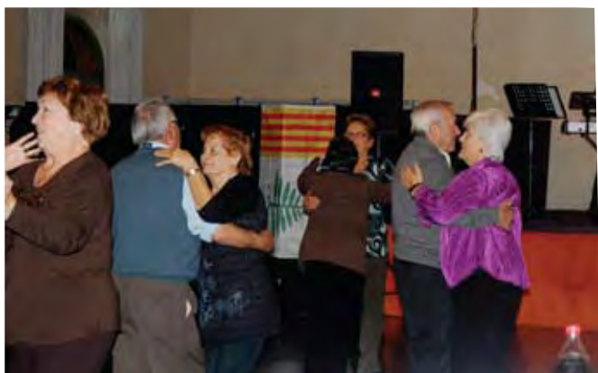
Ball de la gent gran.