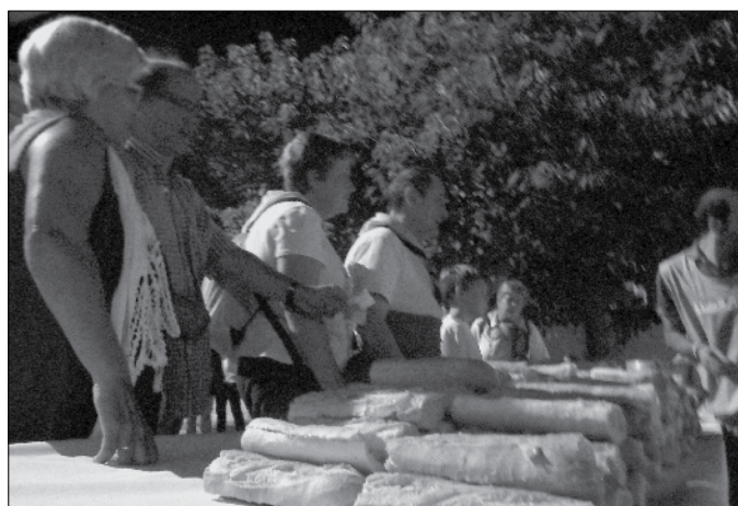
Els Gegants esperant les butis a la Setmana de la Joventut.