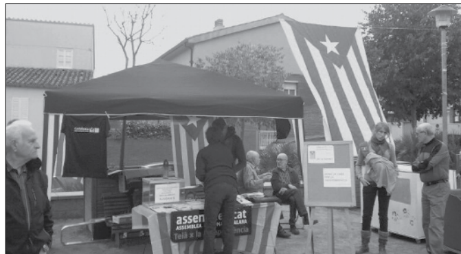
Paradeta promocional de l'ANC.