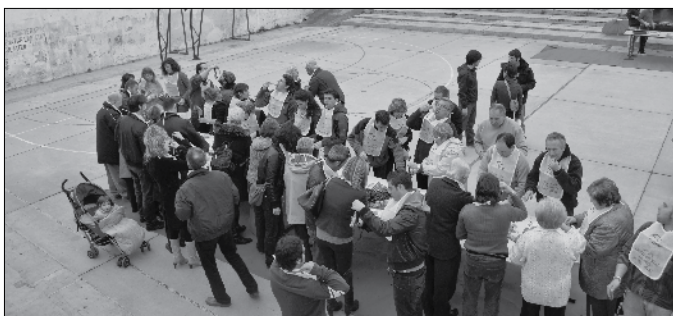
Calçotada 2010 a la Pista de l'AE Teià.

Com cada any la Penya Barcelonista organitza al llarg de la temporada un munt d'activitats diverses. Sempre intentem que aquestes activitats estiguin relacionades amb el Club, d'una manera o d'una altra. Fem sortides per anar a veure el Barça; tant a domicili (almenys dos cops l'any) com desplaçaments al Camp Nou (cada vegada que hi ha partit amb l'autobús de la Penya). També fem trobades gastronòmiques, com la pesolada, o els Sopars de Temporada, siguin d'aniversari o solidaris com el de la Marató de tv3. La tradicional Calçotada del mes de febrer a Teià. Tampoc falta la visita anual al Museu del Barça, i un bon nombre de rifes i participacions en la loteria, que ens permeten eixugar les despeses que, sobretot el local del Masnou, ocasionen. Aquestes activitats ens permeten gaudir de bones estones de germanor entre tots els socis.