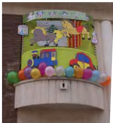
Balcó de Francesc Gavilan.