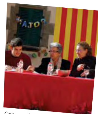
Concurs de relleno.