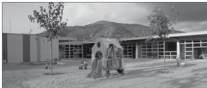
Escola bressol Els Galamons.

Actualment l'aportació de la Generalitat s'ha rebaixat fins a 875 € per nen escolaritzat. L'augment dels 10 € mensuals a la quota d'escolarització a partir de gener 2013 suposarà un impacte de 70 € per nen per a les famílies durant aquest curs 2012-2013, que equival a un 16,5 % de la menor aportació de la Generalitat.