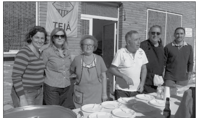
Els cuiners de la botifarra esparrecada.

La Fira del Bolet, organitzada des de la Regidoria de Promoció Econòmica, va comptar amb nombrós públic assistent el passat diumenge 28 d'octubre.