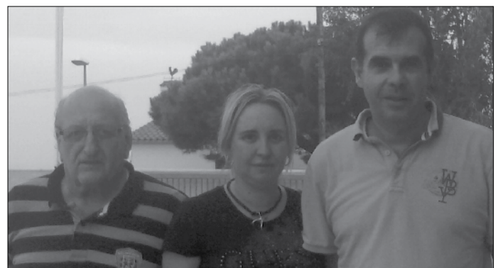
El president del club i els dos vicepresidents.