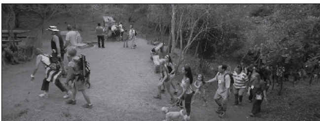
Desnivells durant la travessa.