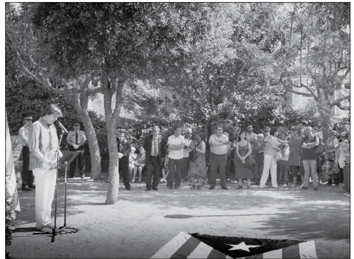
Parlaments davant del monument a Rafael Casanovas i Sebastià Dalmau.