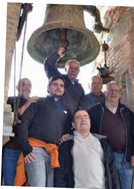
Repicada de campanes.