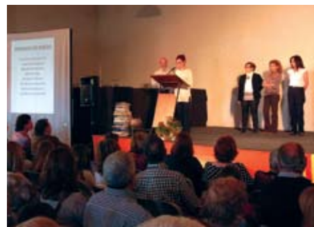
Entrega de premis de la Mostra Literària.

pectacle familiar ambientat en l'atmosfera del Tricentenari amb "el silenci de la campana", tallers infantils i l'entrega de premis de la fase local de la Mostra Literària del Maresme. Com a acte de clausura del programa de la Setmana Cultural i com a esdeveniment més de commemoració del Tricentenari, vam rebre la visita de l'historiador i polític Jaume Sobrequés i Callicó, que durant gairebé dues hores va desgarrar la història dels catalans fins a arribar als nostres dies i deturant-se minuciosament en els segles XVII i XVIII. ■