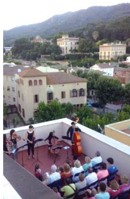
Concert de la presentació de la regidoria d'Infància.

Sens dubte, el concert va ser la millor manera de fer la presentació de la regidoria d'Infància. ■