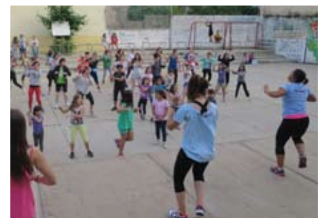
Sessió de Zumba a l'aire lliure.

Els passats dies 6, 7 i 8 de juny va celebrar-se novament la Festa de l'Esport, organitzada conjuntament per la regidoria d'Esports i les entitats esportives i que va comptar amb una gran participació de teianencs i teianenques. Unes 400 persones van participar activament en les propostes programades. AE Teià, Club Excursionista Teià, Amics Judo Teià, Teià Futbol 5 i Club Patinatge Teià van proposar les seves activitats per as-