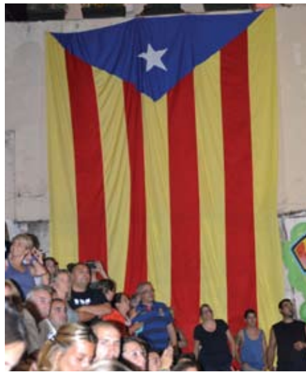
Una estelada gegant va presidir la final.