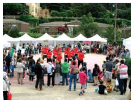
Els tabalers dels Dimonis de Teià animant els assistents amb una batucada.