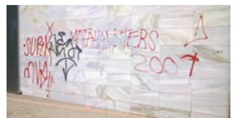
Grafitis apareguts al Poliesportiu Municipal.