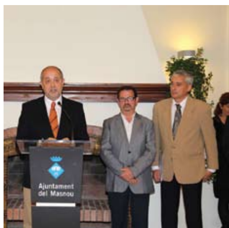
Felip Puig durant la inauguració del Centre d'Empreses Casa del Marquès.

El passat 31 de maig es va inaugurar el Centre d'Empreses Casa del Marquès, un equipament que ha entrat en funcionament donant allotjament a 11 empreses. A l'acte hi van assistir els alcaldes dels tres municipis que participen del