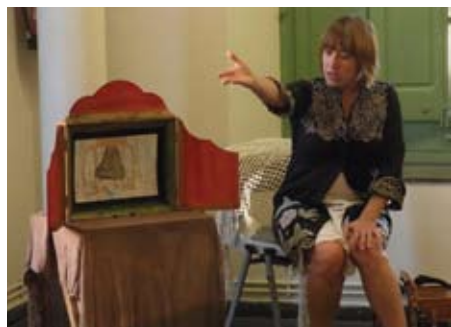
Presentació de "Contes de la Mediterrània"

Paral·lelament, i amb motiu dels actes commemoratius del Tricentenari de 1714, a la Plaça de la Cooperativa vam acollir l'exposició oficial del Tricentenari "Catalunya: 300 anys després", que planteja una mirada detallada sobre