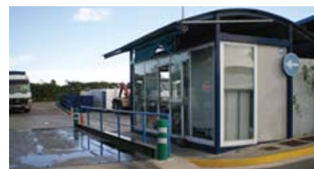
Entrada actual de la deixalleria de la Mancomunitat.

Per tot això, el pressupost 2014 està orientat a corregir aquestes qüestions, amb una retenció de les inversions planificades no immediates i amb l'aprovació al proper ple d'un Pla Econòmic Financer per corregir les deficiències de la liquidació 2013. ■