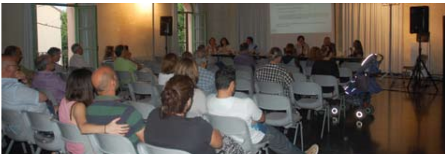
Primera audiència pública de l'equip de govern després de la moció de censura.

Finalment i per acabar l'acte, l'equip de govern va atendre les preguntes dels assistents, prenent nota dels suggeriments que van anar sorgint. ■