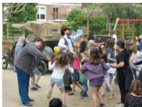
El grup Argot Teatre oferint l'espectacle de carrer Action.

Tot seguit, us deixem un recull d'imatges de la Fira. ■