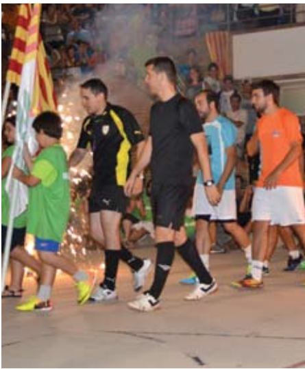
Els finalistes del 2013 entrant al terreny de joc.

Paral·lelament, hem signat l'anomenat "Manifest pel 9N", donant el nostre COMPROMÍS i posant-nos a disposició de l'ANC a col·laborar en la celebració de la consulta, i oferint el nostre suport al President de la Generalitat quan aquest la convoqui. ■