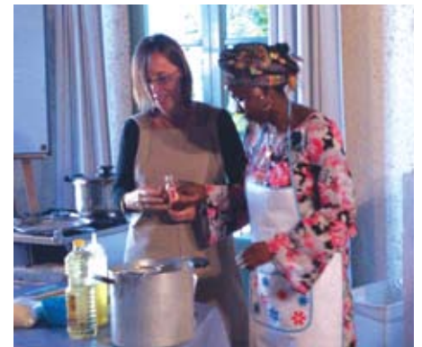
Parella lingüística durant el taller.