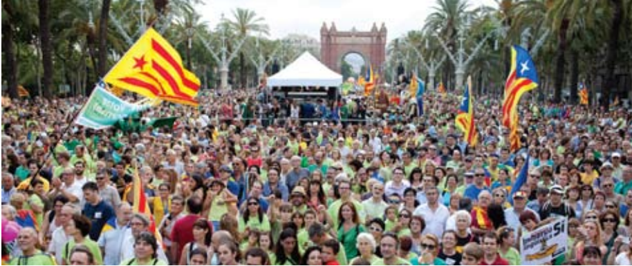
Manifestació del 14 de juny en favor de l'escola catalana.

El malestar de la societat per la situació que s'està vivint en aquests moments s'ha posat de manifest en els resultats de les eleccions al Parlament Europeu. Han estat un revulsiu, com s'està confirmant dia a dia: els bons resultats d'uns i sobretot els mals resultats d'uns altres, estan produint renúncies i dimissions en diferents partits, però no han aconseguit que l'immobilisme dels principals partits polítics espanyols canviï.