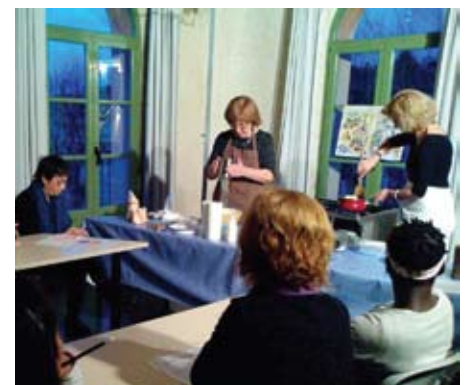
Taller de cuina: Cuinem, parlem i mengem.