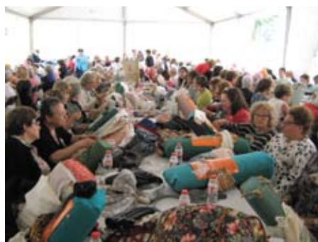
XX Trobada de Puntaires a la carpa de les Teixidores i Ordidores.