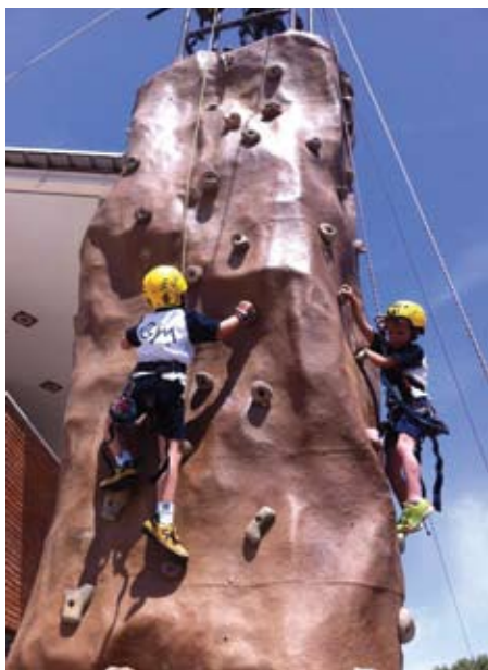
Activitat d'escalada amb tirolina.

Una festa plena d'activitats esportives per a què hi juguin les famílies, els més grans. És un dia on s'intenta que les activitats estiguin enfocades en els àmbits recreatius, populars i oberta a la participació de tothom, sense límit d'edat i amb el propòsit de què hi tinguin cabuda tots els col·lectius. ■