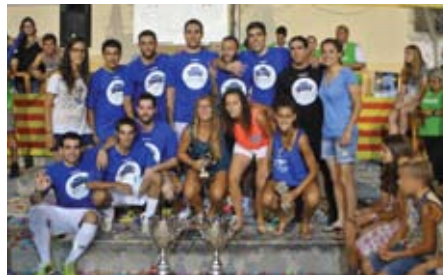
Guanyadors del torneig en la categoria sénior.

A les finals de diumenge no hi van faltar els ja tradicionals balls de nens, la botifarrada i per segon any consecutiu, el desplegament de l'estelada gegant, mentre sonaven els Segadors a la final de noies, i la pancarta ARA ÉS L'HORA, en la final de nois.