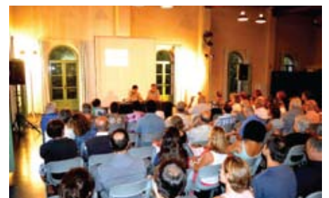
Enric Calpena explicant el setge de Barcelona a La Unió.