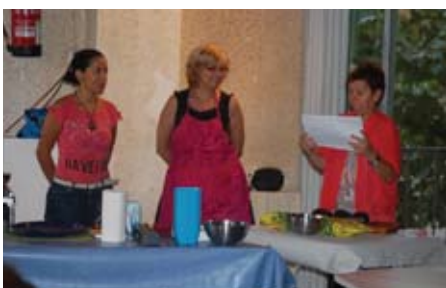
Durant el taller Cuinem, Parlem, Mengem.