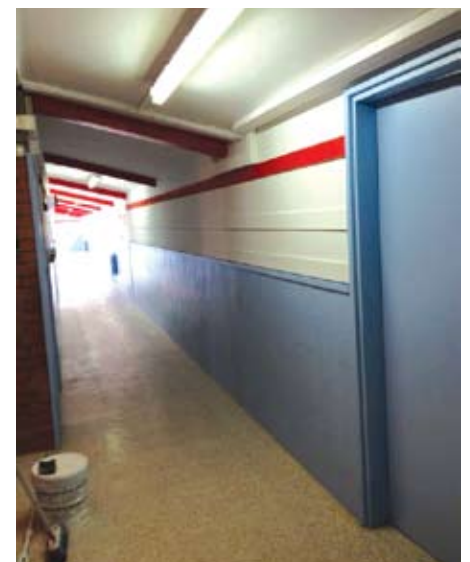
Passadís de l'escola un cop pintat.

Cal recordar que resta pendent per part del Departament d'Ensenyament solucionar les deficiències constructives que té el gimnàs nou i realitzar la segona fase de reforma de l'escola el Cim aprovada l'any 2008 i suspesa sine die. ■