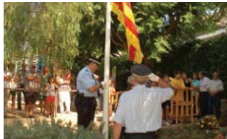
Hissada de la Senyera.