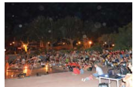
Espectacle de circ durant el sopar popular.