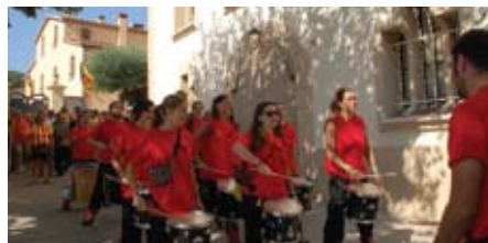
Els tabalers de Teià dirigit-se cap a l'ofrena floral.