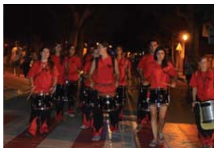
El cercavila nocturn baixant la Riera.