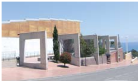
Poliesportiu Municipal El Cim.

Una aposta ferma per l'activitat esportiva que es desenvolupa en el Poliesportiu és la clau d'uns resultats sense precedents en la seva gestió. La combinació de les activitats programades des de la regidoria d'Esports i la cessió d'espais per a les entitats que ho sol·liciten, és la fórmula perfecta per tenir un poliesportiu funcionant a ple rendiment, que ha fet que enguany, s'hagi sol·licitat a la Diputació de Barcelona l'elaboració, sense cost, d'un projecte de nova sala de fitness per tal de donar resposta a la continua demanda d'usuaris, en creixement constant, i que s'executarà quan la capacitat econòmica de l'Ajuntament i les línies de subvenció ho permetin.