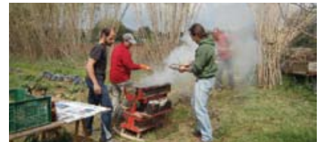
Una de les trobades anuals és la calçotada.