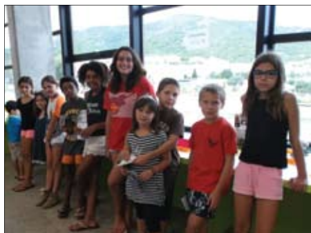
Els participants del Passaport a la lectura.

El setembre era el final de l'aventura. El dia 9 es va fer un sorteig de 9 entrades dobles per anar al Bosc Vertical, a Jalpí Aventura, al Cim de les Àligues, al Centre d'Apropament a la Natura i a Butterfly Park. A més a més, tots els participants