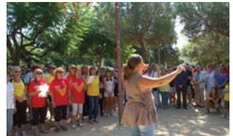
La Coral Esclat entonant Els Segadors.