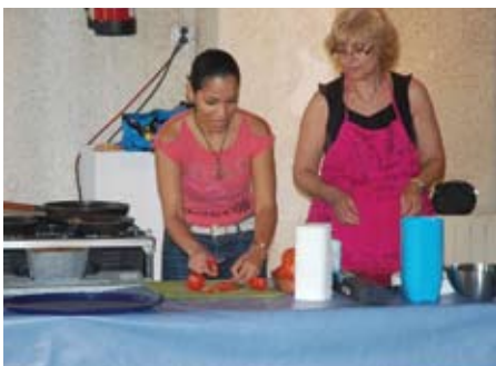
Parella lingüística durant el taller.

Per a més informació Oficina de Català, de 10 a 14 h - tel. 93 540 93 50 ■