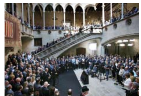
Final de l'acte amb els alcaldes d'arreu del territori.