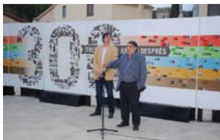
Inauguració de l'exposició a la plaça de la Cooperativa.

Un programa doncs, en què hem apostat ferventment, perquè reivindicuem que el millor per avançar cap al futur és conèixer el nostre passat. ■