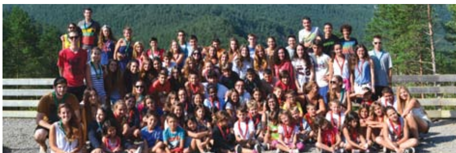
Colònies d'estiu 2014, La Pobra de Lillet

joc i el lleure. Amb les activitats, acampades, sortides i colònies, els més menuts i també els grans, aprenen els valors de la convivència i la participació. L'Esplai també participa activament en les diferents festivitats del poble i, des de fa un any, organitza una macro-calçotada oberta al poble, hi esteu tots convidats! ■