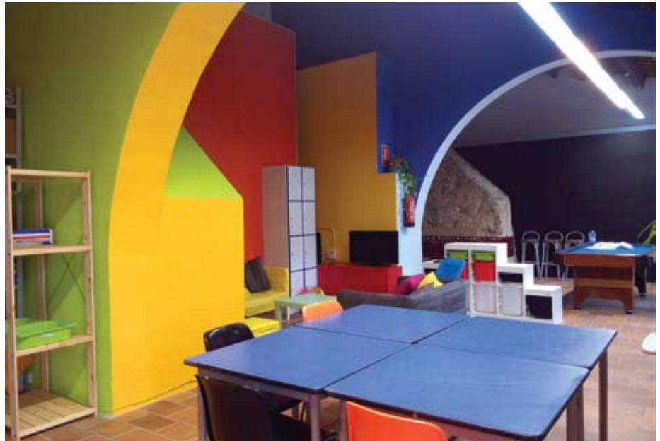
El Casal de Joves després de la reforma.