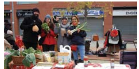
Participació a la Fira de Segones Oportunitats a Alella.