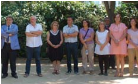
Alcalde i regidors durant el parlament del regidor de Cultura.

El Consistori, les entitats i els presents van viure amb emoció l'interpretació dels Segadors per part de la Coral Esclat i l'hissada de la bandera, amb què es va cloure l'acte institucional. ■