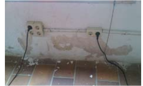
Situació de la instal·lació elèctrica amb les humitats.