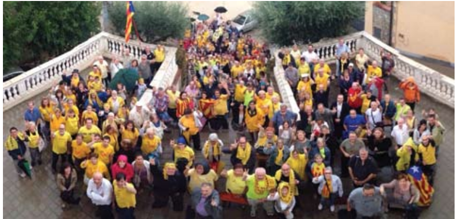
Concentració davant l'Ajuntament per mostrar el rebuig a la decisió del TC de suspendre la consulta.

És important, però, veure l'actual situació amb una altre prisma. Quina és la visió de la nostra realitat per part del Govern de Madrid?. La primera impressió sembla que és una forma d'aconseguir una atractiva majoria a través d'un enfrontament de la resta d'Espanya contra Catalunya, amb raonaments que som poc solidaris i diferents de la resta. Però si hi aprofundim una mica, podrien aconseguir el mateix resultat amb inversions