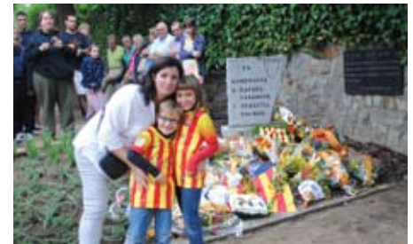
Ofrena floral dels Llubakus, l'11 de setembre.

D'altra banda, el passat 11 de setembre la nostra entitat va participar als actes de la Diada, primer, amb el lliurament a les autoritats locals del document en Suport a la consulta del 9N , i després a l'Ofrena tradicional davant el monòlit a Rafael de Casanovas i Sebastià Dalmau. ■