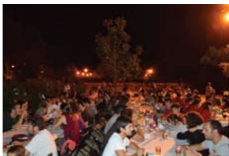
El sopar popular al parc de Can Godó.

Moltes felicitats a la Komissió Jove! Gràcies per la vostra feina! ■