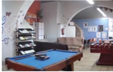
El Casal de Joves abans de les obres.

I i fins i tot, hi tenim televisor i Wii. Ets jove? Doncs no dubtis a venir! Et podràs connectar a internet, fer tallers, torbra-te amb els companys, jugar a billar o futbolí, veure pel·lícules o organitzar festes i fins i tot, consultar els dubtes que tinguis sobre salut, treball, educació, sexualitat (de manant cita prèvia). No t'ho pensis! Tens alguna idea? Vols organitzar algun taller? Vine i t'escoltarem! Al Casal, hi tenim de tot! I sinó, mireu com ha quedat! ■