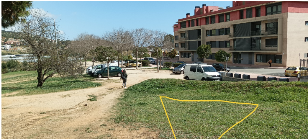
Imatge del tercer grup.

El quart grup serà pròxim dels 3 anterior.