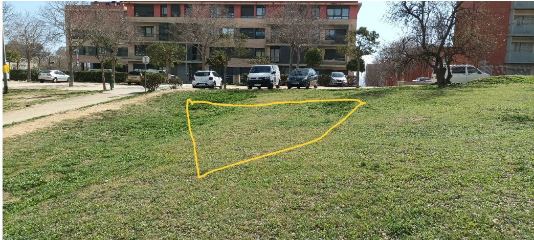
Imatge del segon grup.