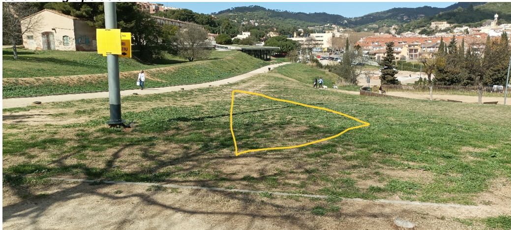
Imatge del primer grup