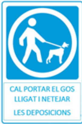
Fotografia 3 Senyal amb llegenda

Vistos els anteriors fets i fonaments de dret, la Junta de Govern Local, a proposta de la Regidoria competent,