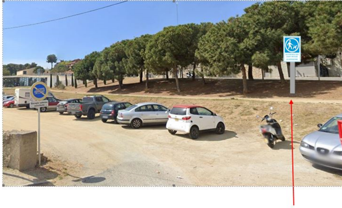
Fotografia 2 Senyal a l'entrada del camí d'accés a la biblioteca