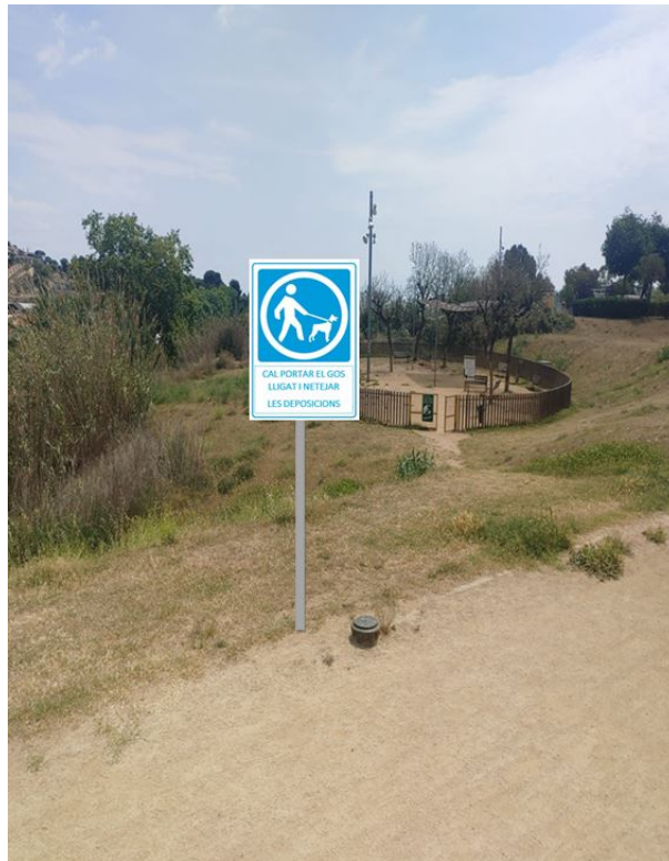
Fotografia 1 Senyal camí davant pipican