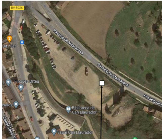
Lloc on s'hauria de col·locar la caseta de venda de pirotècnia

La policia local ha determinat la millor ubicació per la Ocupació de la Via publica.