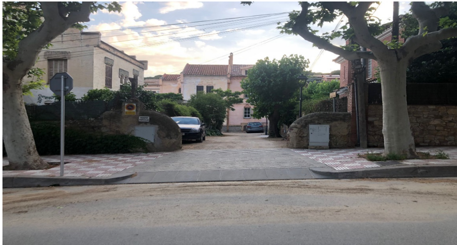
Annex 2. Ubicació mirall deflector al Passeig de la Riera